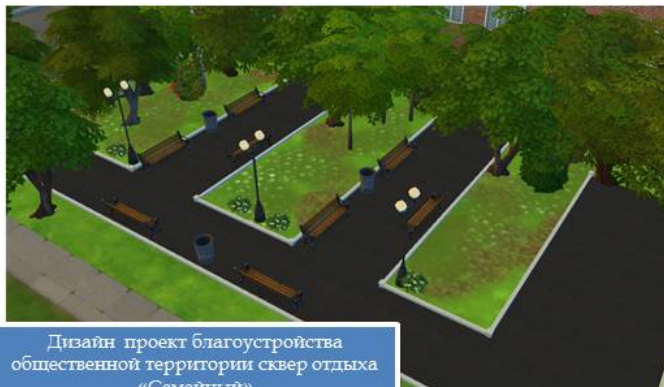
Дизайн проект благоустройства общественной территории сквер отдыха «Семейный» с. Ракитное, Центральная 28а

постановлением администрации Ракитненского сельского поселения от 07.08.2019 № 259